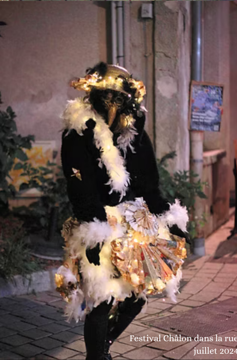
Festival Châlon dans la rue juillet 2024

Dans une ambiance musicale féerique, elles viennent à la rencontre du public.