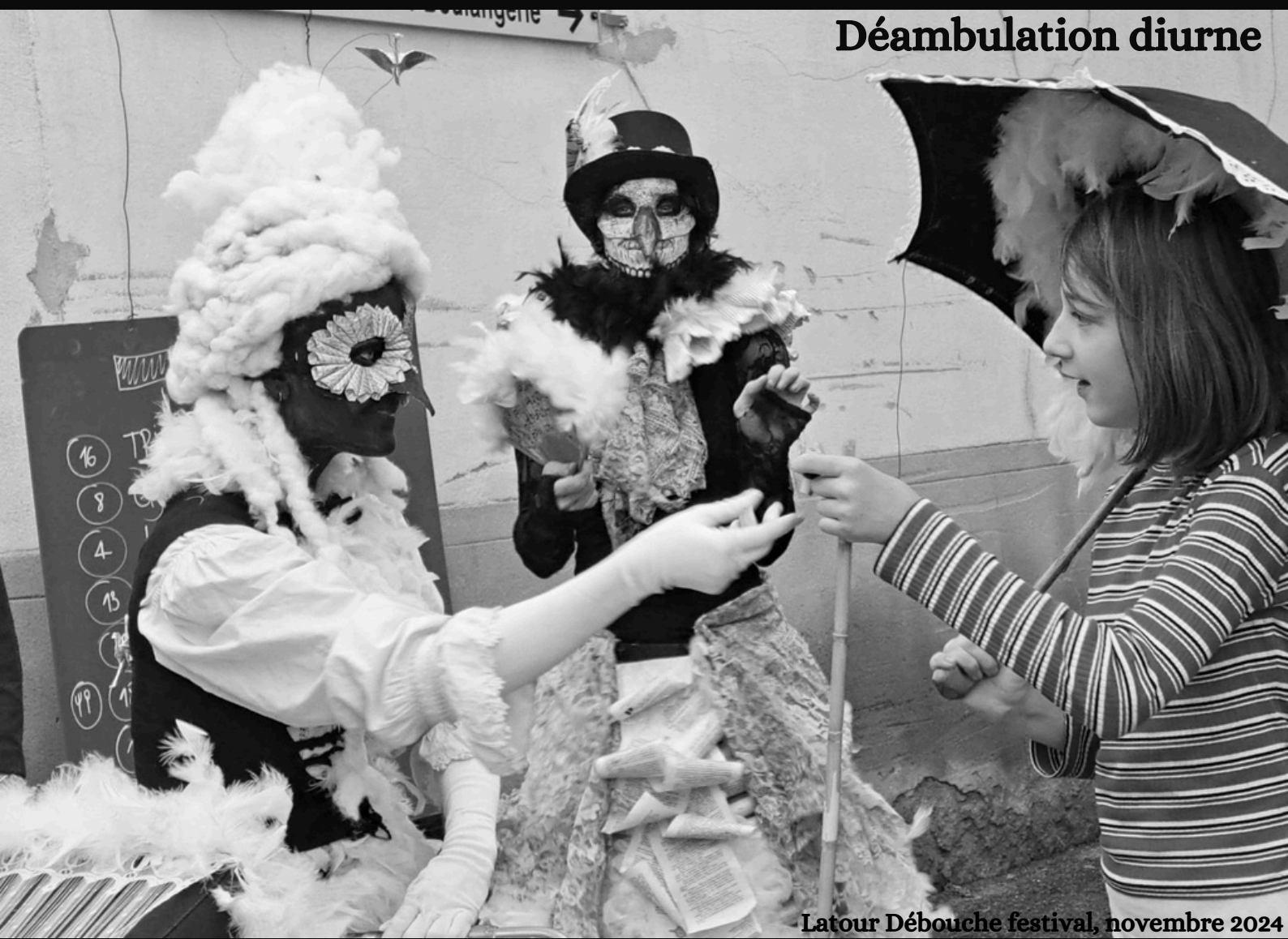
Latour Débouche festival, novembre 2024