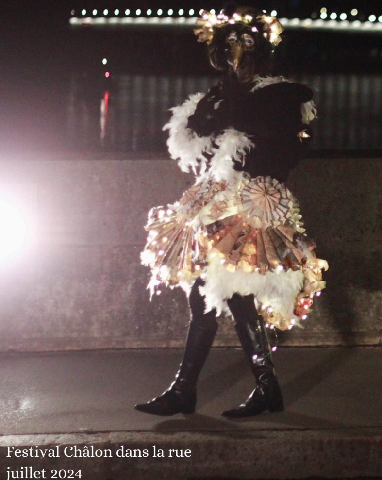
Festival Châlon dans la rue juillet 2024