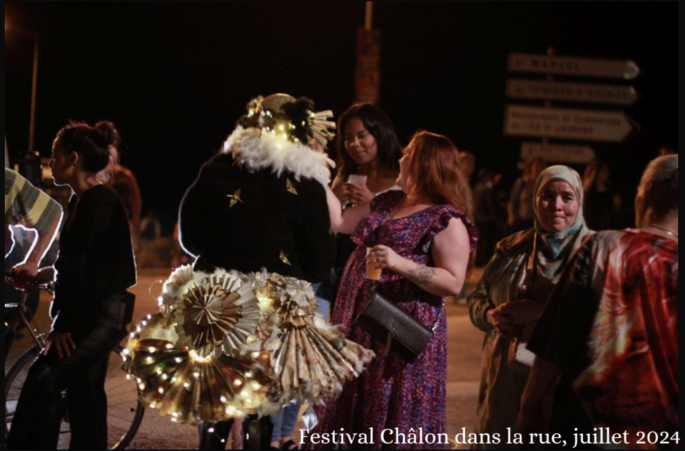
Festival Châlon dans la rue, juillet 2024