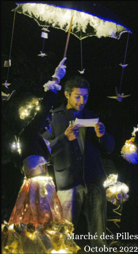
Marché des Pilles Octobre 2022