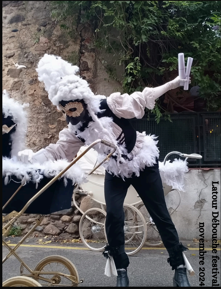
Latour Débouche festival novembre 2024