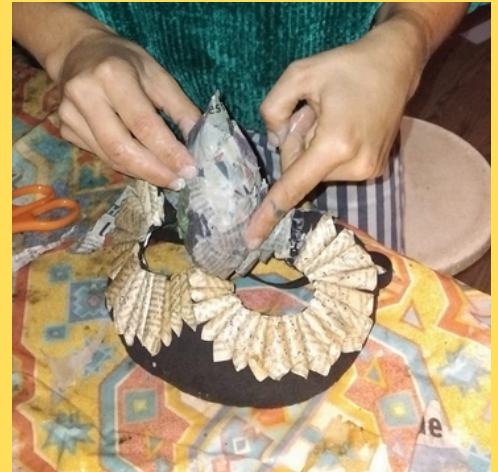
Personnaliser le masque