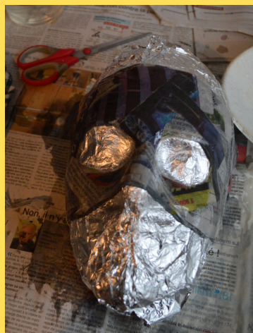
Créer le masque en papier mâché