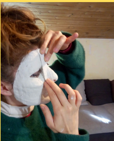
Créer un moule en plâtre